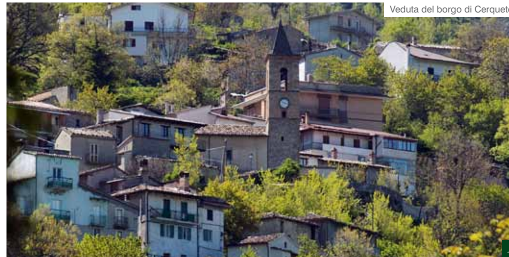
Veduta del borgo di Cerqueto

Definita la "perla del Gran Sasso", Fano Adriano incanta con la sua quiete e rigenera con la salu-