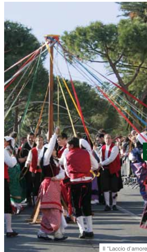
Il "Laccio d'amore"

Posta com'è su un colle, Penna Sant'Andrea regala una vista magnifica e completa sulla Valle del Vomano. Per quanti amano la natura, l'appuntamento è con una passeggiata nella riserva naturale regionale di Castel Cerreto . Il borgo deve la sua fama al " Laccio d'amore ", un'antica danza popolare eseguita nelle feste e soprattutto nei matrimoni, al fine di propiziarne il buon esito. Agli inizi del '900 si è costituito il gruppo folkloristico omonimo, che ha reso famosa la danza in tutto il mondo.