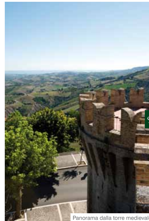
Panorama dalla torre medievale

la cultura contadina rivivono nella gastronomia, che annovera quale piatto tipico i " Cingoli al sugo di papera ".