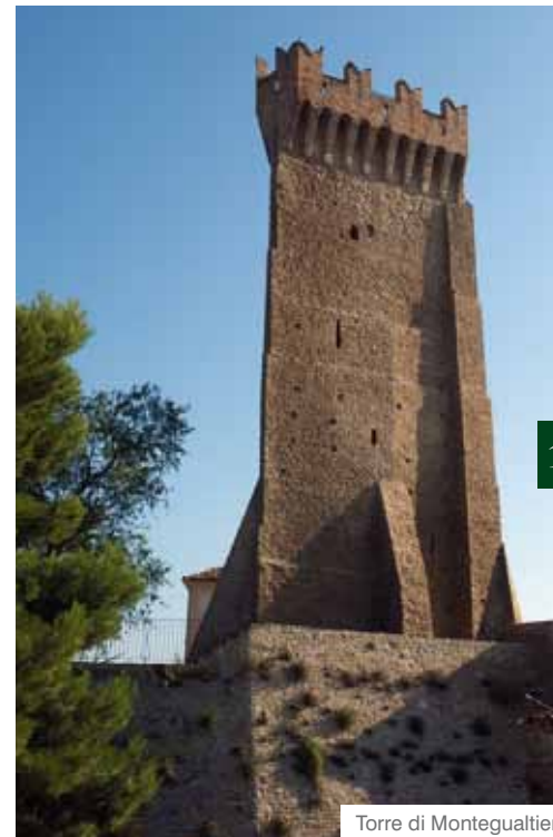
Torre di Monteguallieri

gusta vin brulé, accompagnato dai " Cillette di Sand Andonje ", biscotti tipici, a forma di uccello, con ripieno di marmellata di uva .