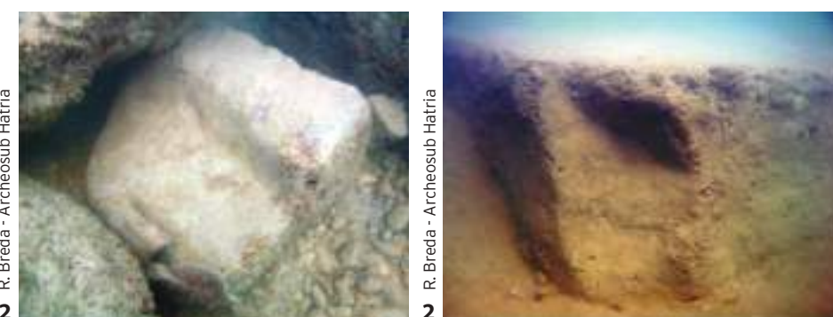
2 R. Breda - Archeosub Hadria

Le ricerche subacquee svolte tra il 1982 e il 1985 hanno documentato l'esistenza di questo porto. Dubbie sono le origini di tali resti ma certe sono le fonti storiche che indicano l'esistenza di un