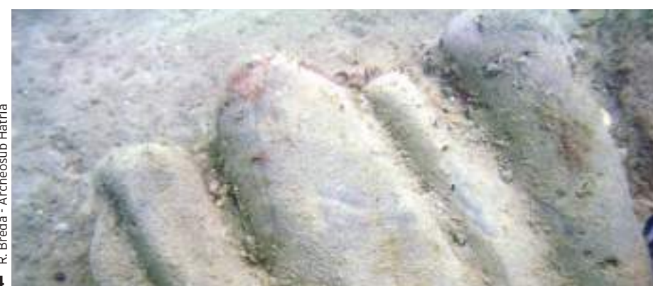
4 R. Breda - Archeosub Hadria

epineion (arsenale sul mare) in epoca romana. Il porto era ubicato sulla "...plagia Cerrani..." e come recitano documenti del 1307 e del 1309, l'area all'epoca doveva rappresentare un'importante punto di scambio di intensa e di fiorente attività, tanto da presentare al suo interno la torre, molte case, un ospizio, un oratorio, un chiostro, una chiesa e intense attività di scambi commerciali di legname fino da lavoro, lana, ceramiche, grano ed orzo con la Dalmazia, con l'Adriatico settentrionale e soprattutto con la Puglia.