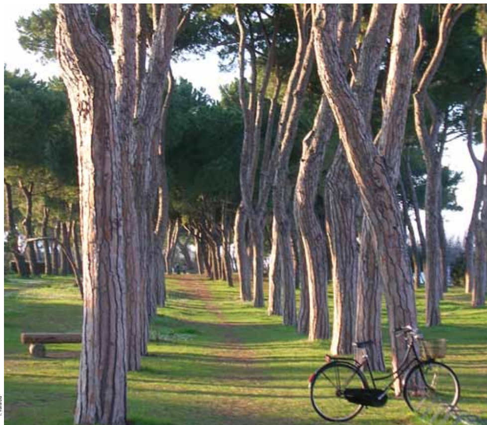
1 - F. Villano

Fu Luigi Corrado Filiani, possidente colto e lungimirante, ecologo ante litteram , ad avviare, ai primi del '900, il progetto che avrebbe segnato la storia e il contesto urbanistico della futura Pineto: la realizzazione di una pineta litoranea, che riproponesse la situazione dell'antica selva litoranea scomparsa a causa del forte utilizzo del legname attuato nei secoli precedenti. Filiani iniziò l'impianto dei pini nei primi anni '20 a sud del torrente Calvano, proseguì fino a terminare con gli ultimi impianti realizzati nell'area prospiciente il quartiere Corfù di Pineto e, come omaggio al D'Annunzio de "La