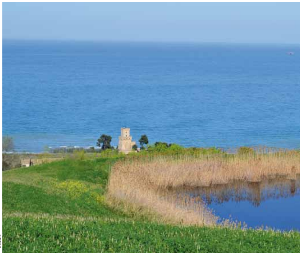
M. Adornante 1

Fra cielo e terra uno specchio d'acqua protetto dove coltivare le preziose risorse del mare. L'Area Marina Protetta Torre del Cerrano si trova in Abruzzo, la "regione verde d'Europa" con oltre il 30% del territorio tutelato. Nel tratto teramano, fra due Comuni, Pineto e Silvi, l'Area Marina Protetta delimita 7 chilometri di costa e si estende fino a 3 miglia nautiche; completa un