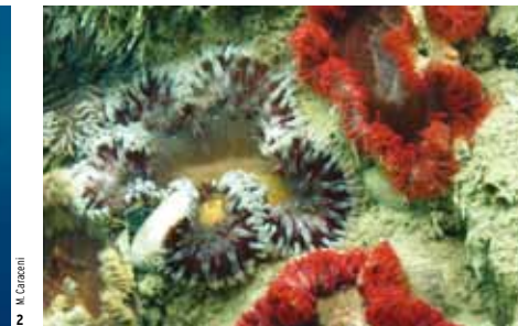
2 - M. Corradi