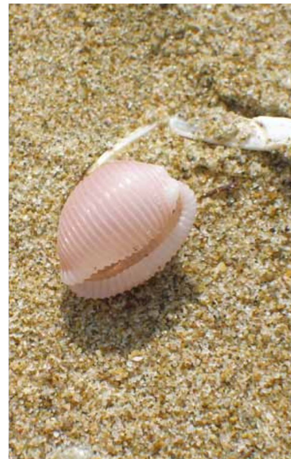
4 - F. Villano

Lo specchio d'acqua dell'Area Marina Protetta Torre del Cerrano, presenta due tipologie ambientali ben distinte e in stretta relazione tra esse: i tipici fondali sabbiosi adriatici, che caratterizzano la porzione più estesa dell'area, e alcune parti di scogliere di fondo, determinate sia dai massi semisommersi dell'antico porto di Atri che dalle strutture sommerse dell'oasi di protezione marina provinciale, oltre che da alcuni affioramenti di formazioni geologiche conglomeratiche. Nell'area è presente un buon numero di specie animali marine sia pelagiche che bentoniche e un piccolo ma nutrito contingente di specie vegetali. Oltre ai bellissimi esemplari di un piccolo e raro Gasteropode dell'adriatico, come la Trivia adriatica, e alle imponenti biocostruzioni della Sabellaria halcocki, nell'ambiente subacqueo dell'area protetta è facile imbattersi in svariate specie di pesci e molluschi tra i quali spiccano gronchi, spigole, sogliole e saraghi, che vivono a contatto con i fondali sabbiosi caratterizzati da estesi e importanti banchi di Chamelea gallina , la piccola vongola dell'Adriatico localmente chiamate "Paparazza".